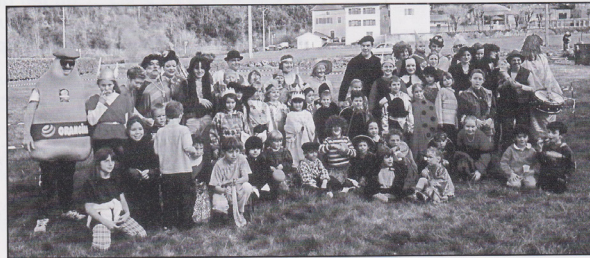
La Section "Atelier du Mercredi" lors du Carnaval 1999

SARL FANGEAT-DOLIN Tél. 04 76 38 02 68 - 38160 SAINT-MARCELLIN